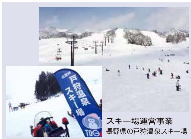
スキー場運営事業 長野県の戸狩温泉スキー場

人と環境にやさしい太陽光発電システムを取り扱っています。平成25年には東近江市にメガソーラー発電所を建設しました。