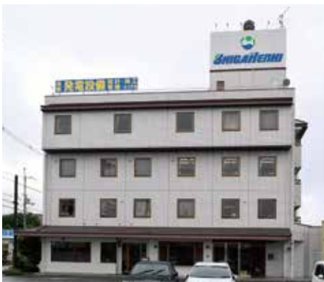
滋賀建機株式会社 愛知県愛荘町中宿160-1 TEL:0749-42-8668 http://kenki.sk-grp.co.jp/

わり、社内が融和し団結することで社風が変わります。ただ利益を追い求めるのではなく、人と人とのつながりや人を活かすことの大切さを重視することで、会社が変わっていったことを実感しています。