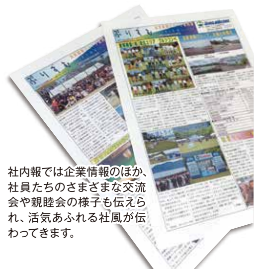
社内報では企業情報のほか、社員たちのさまざまな交流会や親睦会の様子も伝えられ、活気あふれる社風が伝わってきます。

か「荷物」と考えるかで2代目、3代目経営陣の真価が問われることとなります。積み上げてきた企業財産をいかにして増やしていくことができるのか。現在、私は75歳ですが、50周年を迎える80歳まで、いかにして彼らに事業承継していくのか。それが今後の私に託された大きな使命だと思っています。