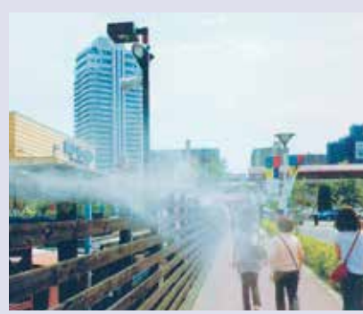
イベント・ミスト事業 会社や地域、各種団体のイベント会場準備、それらのプロモーション業務まで幅広く展開。ステージ、イベント会場、セレモニー会場の設営、体験型アトラクション、展示会ブースの設営、暑さ対策のミスト機器の設置など。また、県内で撮影される映画セットの施工なども手がけています。

の講演活動に出かけては経済界や産業界のさまざまな方々との貴重な出会いをいただき、滋賀県を盛り上げる取り組みにも関わってきました。経営者の姿勢が変われば、社員も変