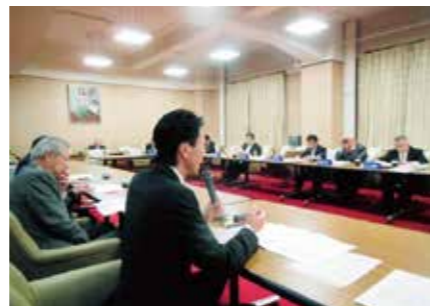
県議会党派との懇談