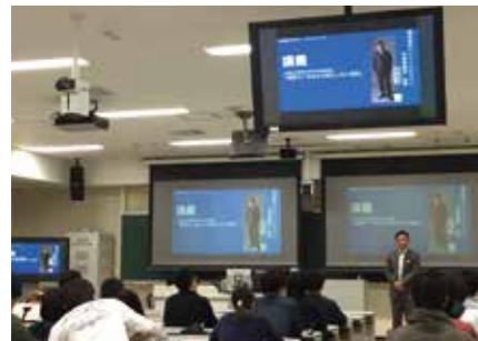
立命館大学情報理工学部企業連携講座