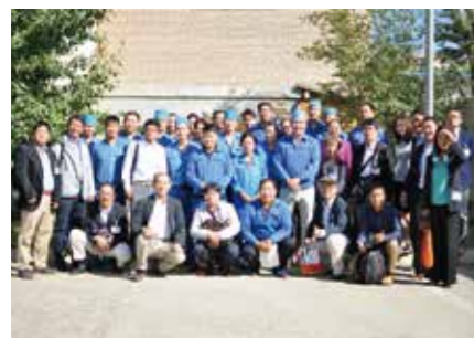
海外ビジネス研究会・モンゴル経済視察