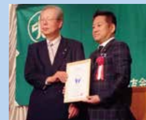
「滋賀でいちばん大切にしたい会社」認定

良い経営環境づくり 「中小企業家の要望と提案」を毎年提出。知事や商工観光労働部長と意見交換し、「中小企業憲章」「県中小企業活性化条例」の具体的な施策推進を目指しています。