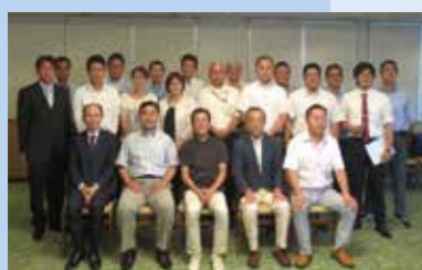
第36期経営指針を創る会卒業式

経営指針を創る会(全6講、年2クール)を開催し、自社の経営の軸となる「経営理念」と、「経営理念」を実現するための「経営方針」と「経営計画」をつなげた「経営指針書」の作成を「創る会」を卒業した先輩経営者と共にすすめています。「経営指針」の確立化は、社員と共に地域にとってなくてはならない会社づくりをすすめていくために欠かせません。経営指針書の作成に向けたサポート(予備校)や作成後の実践フォローも行っています。