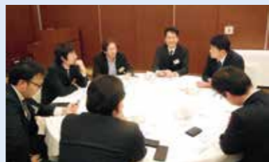
グループでディスカッション