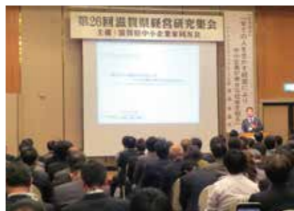
第26回滋賀県経営研究集会