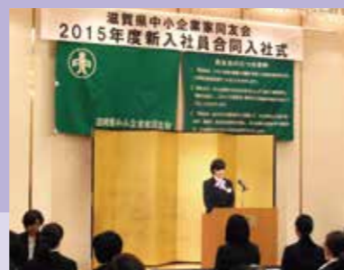
新入社員合同入社式