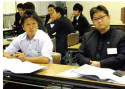
経営指針を創る会