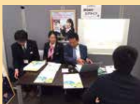
新卒採用・合同企業説明会

中小企業経営の要諦は、人材の採用と育成にあります。地域の多様な人材の採用と育成を担える企業づくりを、経営者と社員が共に育つ「共育」の場づくりを通じてサポートしています。