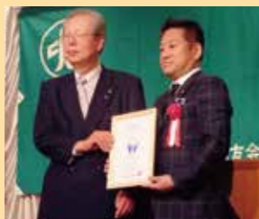
「滋賀でいちばん大切にしたい会社」認定