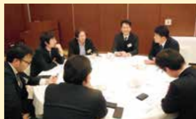
グループでディスカッション