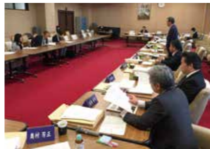
県議会会派との政策懇談会