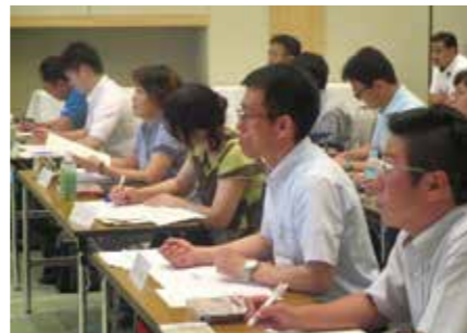
第38期経営指針を創る会