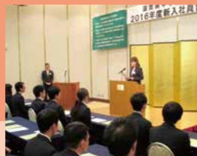
2016年度新入社員合同入社式