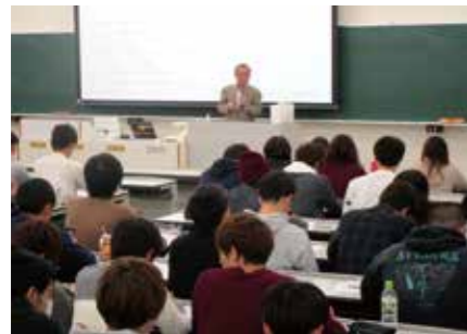
立命館大学経済学部キャリアデザイン講義