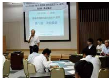
2019年障害者問題全国交流会開催へ決起集会