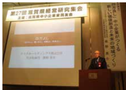
第27回滋賀県経営研究集会