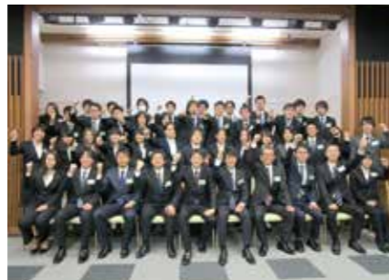
新入社員研修で共に学び合う