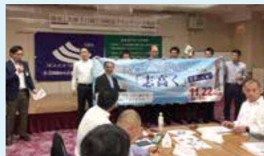
熱く学び合う青年部例会