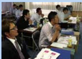
経営指針を創る会

経営指針を創る会(全7講)を開催し、自社の経営の軸となる「経営理念」と「経営理念」を実現するための「10年ビジョン」「経営方針」と「経営計画」を一つにした「経営指針書」の作成を「創る会」を卒業した先輩経営者と共にすすめています。「経営指針」の成文化は、社員と共に地域にとってなくてはならない会社づくりをすすめていくために欠かせません。経営指針書の作成に向けたサポート(予備校)や作成後の実践フォローも行っています。