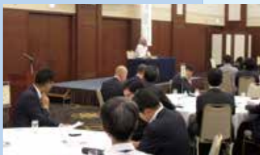
経営体験を学び合う支部例会