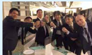
仲間づくり交流会

県内5つの支部で、会員が「知り合い・学び合い・励まし合う」場として毎月例会を行っています。会員経営者を中心とした生きた経営実践の報告と、小グループでのディスカッションで、お互いの経験(失敗も)や教訓を本音で交流しています。また、45才までの青年経営者が志高く学び合う青年部の活動や会員交流会を活発に行っています。