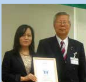
「滋賀でいちばん大切にしたい会社」認定

大学との連携 県内大学とのインターンシップの取り組みや、会員が中小企業経営の魅力を伝える連携講座等を積極的にを行い、中小企業の活性化と地域の若者雇用に努めています。 「滋賀でいちばん大切にしたい会社」認定 人を生かす経営を通じて、世の中から大切にされている会社をモデル企業として認定し、会の内外へ広めています。