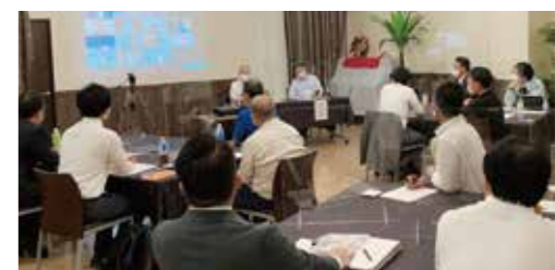
日時:2021年6月15日(火) 18:30~20:45 会場:トラットリアデラメーラ・ZOOM 参加者:40名

これから目指すのは、永続する会社にするための中期計画の設定。利益を出し続ける会社にする。社内では採用した人材がやりがいをもって成長できる環境を整える。仕事のやりがい、仲間とのつながり、会社との信頼関係。失敗を認めて改善にこだわる。75歳まで働ける事業をつくる。社内結婚や子どもさん、友人が働きたくなる会社。だと熱くご報告いただきました。