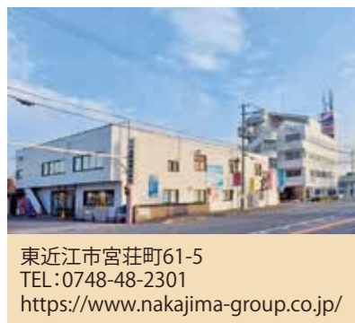
今年8月27日、湖南市にオープンした災害対応型ガソリンスタンド。愛荘町、東近江市に続く3か所目。水2000本備蓄、バルク、10t貯水槽などを設置し、災害時は炊き出しが可能。

対外的には、「コーポレートメッセージ」がありがとうの中島。昔も今もこれからも地域のみならず、