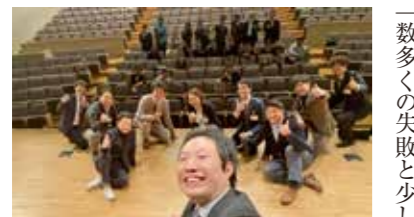
「数多くの失敗と少しの成功体験し、最期にバネリストが全員登壇し、かありません。ただ、分かったことは私たちに伸びしろしかないのです」とまとめられました。

青年部 Welcome例会が10月29日(金)19時から21時30分まで栗東芸術文化会館さくら中ホールとZOOMで開催され、89名が参加しました。コロナの感染拡大で4月から延期し6ヶ月遅れのWelcome例会、テーマを「同友会ですがなにがRevenge!」とし、昨年度と今年度の正副幹事がバネリストとして、「一人ひとりの同友会との関係、気づき学びで自身がどう成長したか、会社はどうなのか、青年部活動はどうかをコーディネーターが引き出し、それぞれが報告。その様子をドキュメントにまとめたムービーが上映されました。