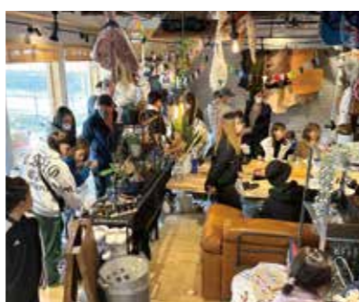
多くの来場者で賑わうマルシェ

また、自分たちを知ってもらうため、DIY作品や雑貨などを出店したマルシェを何度か開きました。たくさんのお客様で賑わい、協力いただいた出店者さんにも喜んでいただけました。人と人とのつながりの場として、これからも定期的に開催したいと思っております。