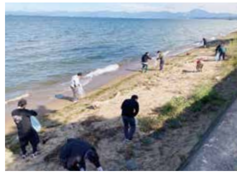
グランピングを楽しんだ社員旅行では、環境貢献・地域貢献の一環として琵琶湖の清掃活動も実施。

「地域完結型まちづくり」を目指して 100年続く企業へ 今後のビジョンとは。 辻本 私たちの世代は、京都・大阪・東京など都市部へ出た人