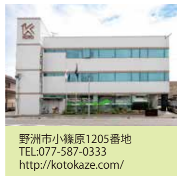
野洲市小篠原1205番地 TEL:077-587-0333 http://kotokaze.com/