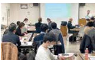
ベースには、経営指針を創る会で学び成文化した経営理念がいきいていると熱くお話しいただきました。