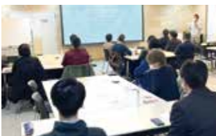
動を変え、今後は継者として生きる覚悟を磨き続けていますという報告に、共感が広がりました。