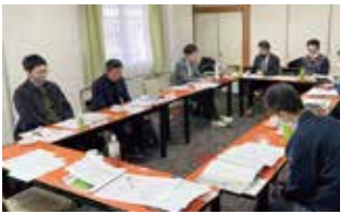
への思いはどうか、熱く問い掛けあいが行われました。第2講は3月11日(土)、琵琶湖マリオートホテルで行います。