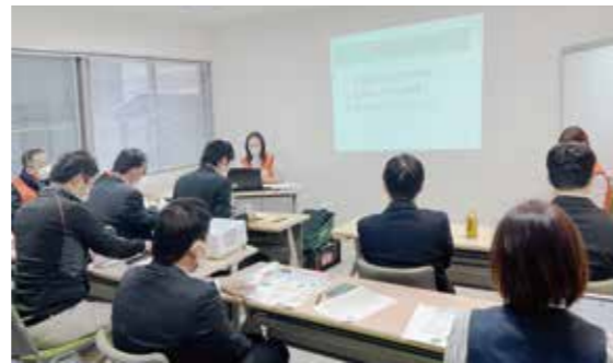
世間の高齢化を見据えて「認知症サポーター」研修などを行う。

進められないという課題もあります。土地開発や活用方法については、野洲市や地域とも連携し、今後も検証を進めていきたいと思っています。 2023年3月21日から事業を継承し、代表に就任することになりました。当社の事業を通じて、地元をより豊かで魅力的なまちにし、「このまちに住んで良かった」と思う人々を増やすことができれば、当社の存在意義があると思っています。 「まちづくり」で地元・野洲に恩返しをしながら、祖父の