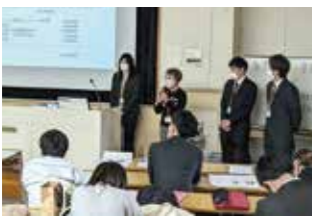
地域を担う課題解決型の人材として活躍していただきたい」と期待が述べられました。