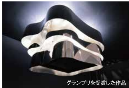
成安造形大学の学生と「産学プロジェクト」を実施。グランプリの作品は、これまでのレンジフードになかったR形状の斬新なデザイン。

先にはオーダーメイドレンジフードメーカーNo.1となるよう認知度を上げ、2030年にはレンジフードのオーダーメイド化が当たり前