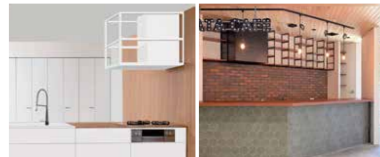
横壁に換気部分を入れ込んだサイドフード型、アイアンを取り付け家具のように見えるHEJのスタイリッシュなレンジフード。

「湖南精工株式会社」に社名を変更。さらに電機メーカーとの合併会社「湖南電機株式会社」を設立し、最盛期には年間約65万台の家庭用洗濯機を製造していました。その後、家庭用洗濯機からコインランドリーなど業務用洗濯機へ転換し、今に至ります。