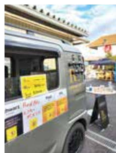
会社の花見など県内の 出張費は3000円で可能