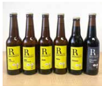
6種類のクラフトビールは、醸造所のほか、 町内の酒販店や道の駅などで販売中

■同友会に期待すること 社内のコミュニケーションアップ や研修などで、ビール醸造体験 を取り入れてみられませんか。