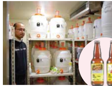
発酵管理工程は醸造所内で行う