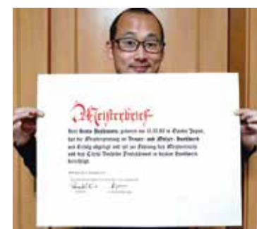
ドイツの国家資格「ブラウマイスター」を取得