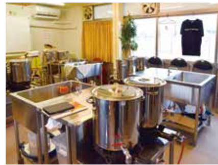
醸造から充填まで、1組45,000円で クラフトビール醸造体験ができる