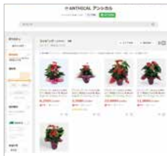
通販サイトや公式サイトでの 小売り販売を強化

した生産方法を通じて、花の力を社会に広げていきたいと考えています。 同友会への入会を通じて、自分の考えを言語化できたことは大きな収穫でした。花は嗜好品ではありますが、創業以来変わらない「はなのある暮らしの実現」に向け、今後もアンズリウムの可能性を追求しながら、世の中の目線に立った農場経営を続けていきたいと思っています。