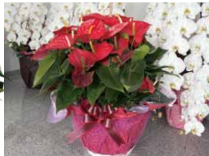
祝い事の中で、ひと際存在感を放つ赤いアンズリウム

せて独自のデザインに仕立てることも可能です。開店祝いや事務所開きなど、企業間の贈答に最適です。まだ珍しさもあり、他社と被ることがほばないため、贈る側にとっては一種のPRとしての役割を果たすこともあるようです。また、世話をすれば、オフィスや店舗で長く楽しんでもらえることも大きな魅力です。