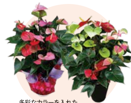
多彩なカラーを入れた オリジナルデザインの鉢